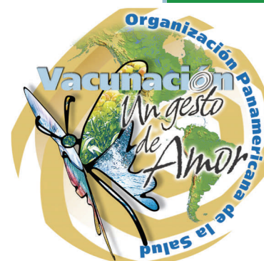
Sticker de la 1ra semana de vacunación en las Américas coordinada y organizada por la Organización Panamericana de la Salud

Actualmente también se recomienda aplicar el toxoide tetánico a poblaciones de riesgo para contraer el tétanos como deportistas, sector salud, herreros, mecánicos, entre otros; cuando una mujer va a embarazarse y también contra la rubéola si no contaba con ella.