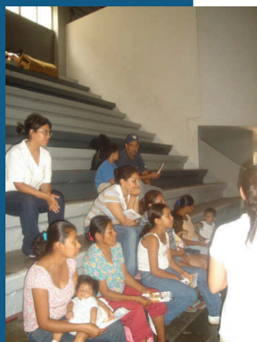
A la izquierda algunos damnificados a los que se impartieron las charlas, a la derecha miembros de OMT momentos antes de la actividad.